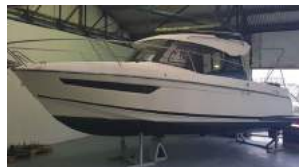
PARKER 750 CABIN CRUISER ANNÉE 2015 46 500 €