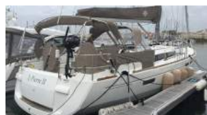
SUN ODYSSEY 479 ANNÉE 2017 279 000 €

D'AUTRES MODÈLES SONT PRÉSENTS SUR NOTRE STAND À FLOT ET À TERRE SUR LE TERRE-PLEIN SUD. VENÉZ NOUS RENCONTRER !