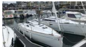
FIRST 255 ANNÉE 2017 55 000 €