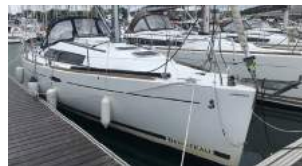
OCÉANIS 31 DÉRIVEUR ANNÉE 2012 65 000 €