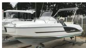
FLYER 6.6 SUN DECK ANNÉE 2017 38 000 €

REPRISE POSSIBLE ET FINANCEMENT, suivant stocks disponibles et configurations des bateaux.