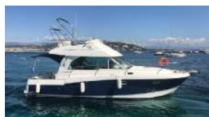
ANTARES 9.80 ANNÉE 2003 69 000 €