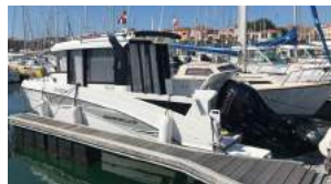
BARRACUDA 8 ANNÉE 2017 63 000 €